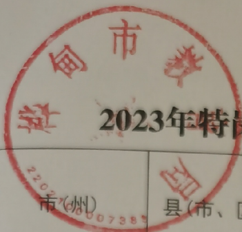
2023年特岗教师招聘空缺岗位计划使用情况统计表